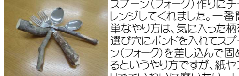
どれも同じものはありません。

マーカーでカラフルに色塗りをしたりと、時間をかけて取り組んでいる子供たちもたくさんいました。可愛いおそろいの Spoon・フォークセットを作る姉妹、「記念に」と体を二人で協力して作るおじいさんとお孫さんなど、思い思いに楽しそうに取り組んでいました。