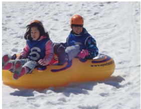
風を切って勢いよく滑り降りました。

第4回あかぎサンサンかがやきキャンプは、2月に1泊2日で行う予定でしたが、積雪のため延期となり、3月4日に日帰りで行いました。内容は当初の予定通り雪遊びをメインに実施しました。参加者は当初より少し減って8名の参加でしたが、2月にできなかった分、みんな楽しみにしていたようです。