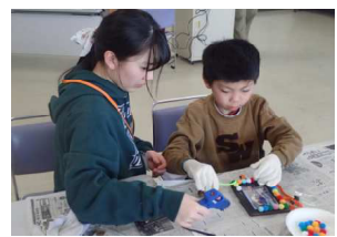
オリジナルのフォトフレームをつくり、みんなで撮った写真を入れました。

昼食は前橋市赤城少年自然の家でいただき、食後には大沼の水の上を歩いてみるなど、自然の家の周辺を散策しました。初めて氷が張った湖に乗った人も多く、驚きの声が上がりましたが、なかなかできない体験の機会となりました。