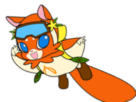
マスコットキャラクター「ササビー」