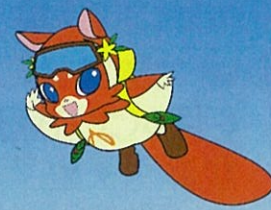
マスコットキャラクター「ササビー」