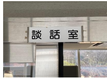
20点 ( A12 ) 談話室入り口