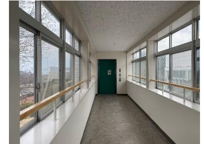
10点 ( A20 ) サービス棟エレベーター2階通路