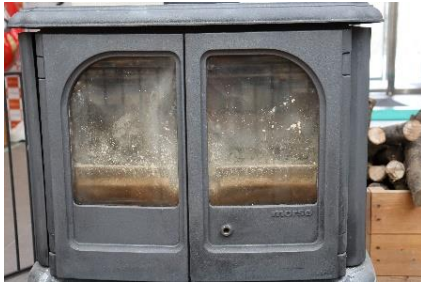
10点 ( A1 ) ロビーのストーブ付近