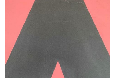
10点 ( A18 ) A棟廊下にある棟の目印