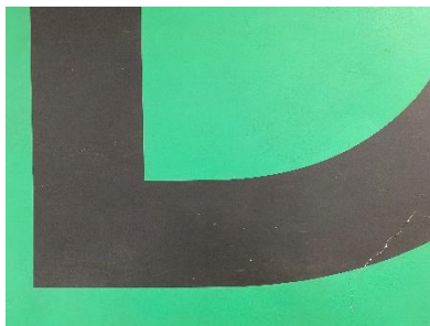
10点 ( A16 ) D棟廊下にある棟の目印