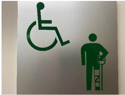
20点 ( A9 ) 第6研修室付近のトイレ