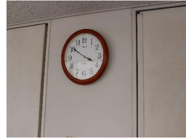
10点 ( A11 ) 談話棟前時計