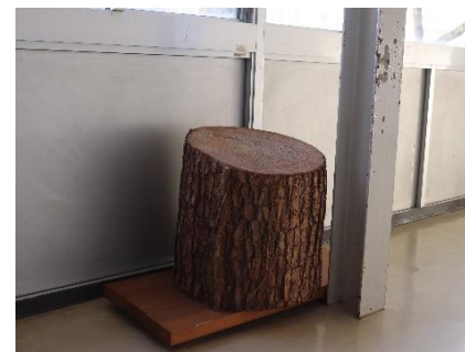
10点 ( A21 ) 体育館前廊下の柱