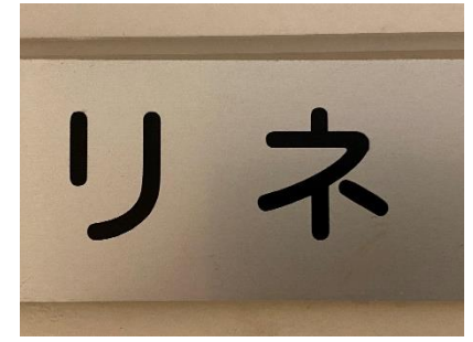
10点 ( A15 ) リネン室入口