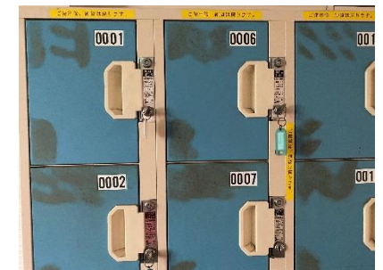
30点 ( A3 ) 計400点 コインロッカー