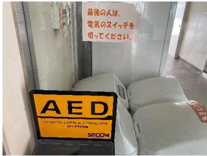
20点 ( A17 ) 食堂出口AED