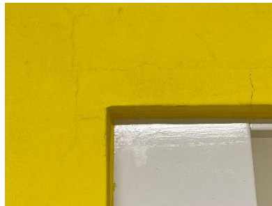
20点 ( A23 ) C棟廊下にある棟の目印