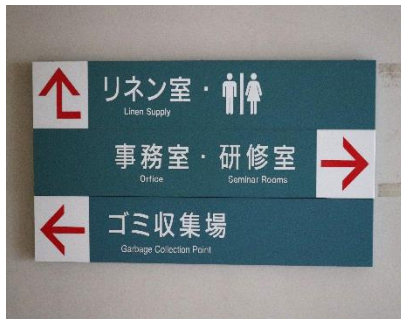
30点 ( A13 ) リネン下前表示の天井