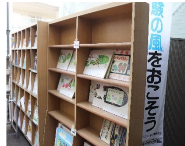
30点 ( A4 ) ロビーの本棚の裏の柱