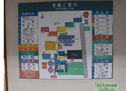
10点 ( A6 ) ロビー全巻案内の下