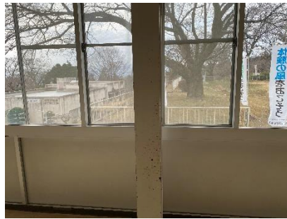
30点 ( A10 ) パネルのある廊下の鉄柱