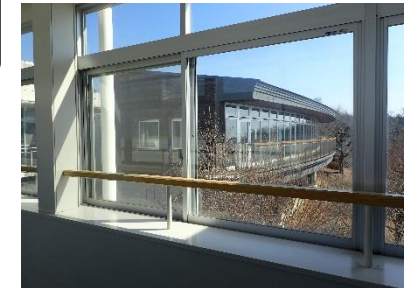
20点 ( A14 ) サービス棟南側エレベーター3階通路