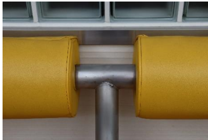
30点 ( A7 ) ロビーのベンチ