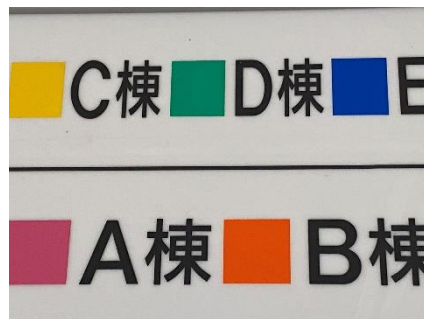
10点 ( A2 ) 宿泊棟への入り口案内板横