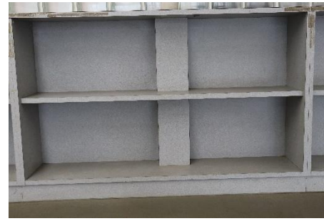
10点 ( A5 ) 玄関横の荷物置き場