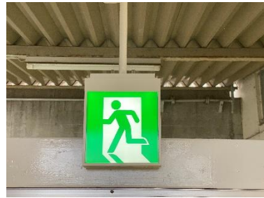
30点 ( A8 ) C棟非常口