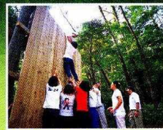
プロジェクトアドベンチャー