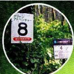
グリーンアドベンチャー番号