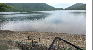
赤城大沼に釣りに行った際の様子。いい景色を眺めながら、ゆったり、のんびり過ごせそうです！