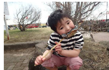
子どもたちもいろいろなブースで、心ゆくまで楽しんでくれた様子でした！

これからも地元のみならずにとってもっと身近で利用したいと思っただけのような施設となるよう、このようなイベントを引き続き行っていきます。10月23日(日)には秋のフェスタを行いますので、また赤城の森にお越しください。(文:黛)