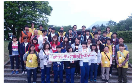
様々な立場の方が、同じ志を持って集まりました。参加者同士の強いつながりも生まれたようです。