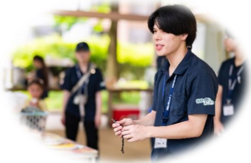
< 教育事業の補助の様子 >