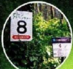
グリーンアドベンチャー番号