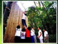
プロジェクトアドベンチャー