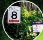
グリーンアドベンチャー番号