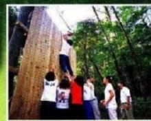
プロジェクトアドベンチャー